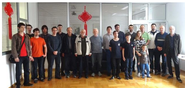
Sudionici Otvorenog prvenstva Hrvatske u gou 2016.